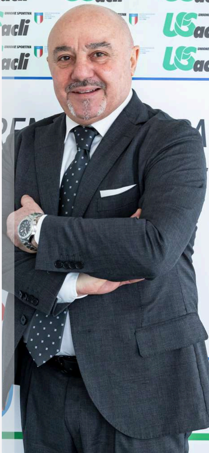
DAMIANO LEMBO Presidente Nazionale US Acli

La ripartenza per la nuova stagione è sempre un momento di grande entusiasmo per tutti noi. Si fa un bilancio di quello che è stato e si studiano i progetti del domani, sempre con il solo obiettivo di rendere l'Italia un paese culturalmente più sportivo attraverso la divulgazione dell'attività motoria e dei suoi valori. Un lavoro reso possibile grazie all'impegno e alla dedizione delle nostre asd e ssd, dei loro dirigenti, tecnici, atleti e volontari. Un mondo al servizio dello sport e che l'US ACLI è orgoglioso di rappresentare. Come ogni anno, poi, le attività che segnano la ripartenza sono tantissime. Dalla Giornata Nazionale "Lo Sport che Vogliamo" a "Cambiare per vincere insieme", la campagna di sensibilizzazione dell'Ente per il contrasto alla violenza sulle donne. Iniziative con ricadute pratiche perché crediamo fortemente nella possibilità di migliorare il paese attraverso lo sport. E sarà bello vivere i prossimi mesi perché saranno quelli che porteranno al Congresso di fine febbraio. Un momento in cui tutto l'US ACLI si riunirà per determinare il lavoro dei prossimi anni dando vita alla massima espressione di democrazia della nostra associazione. A tal proposito il Coni ha approvato il nuovo statuto, modificato in base ai principi informativi recepiti dal Dipartimento dello Sport e questo ci consentirà di attivare il percorso congressuale per il prossimo quadriennio. Nuove sfide e impegni ci attendono, ma l'US ACLI continuerà sempre a fare la sua parte.